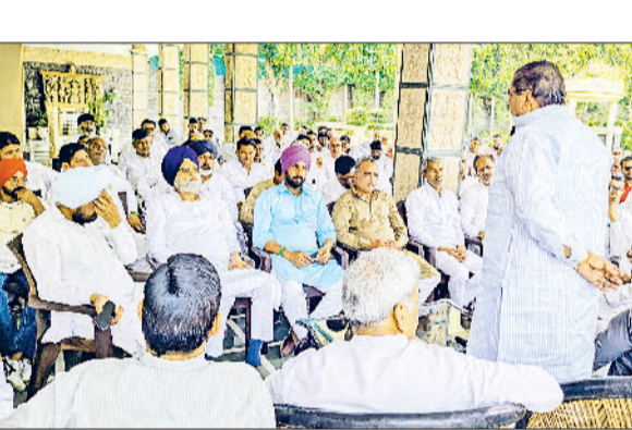
सिरसा। कार्यकर्ताओं की बैठक को संबोधित करते अजय चौटाला।

शुक्रवार को पार्टी कार्यकर्ताओं को संबोधित कर रहे थे। अजय चौटाला ने कहा कि पूर्व डिप्टी सीएम के काफिले को रोकने व हथियार