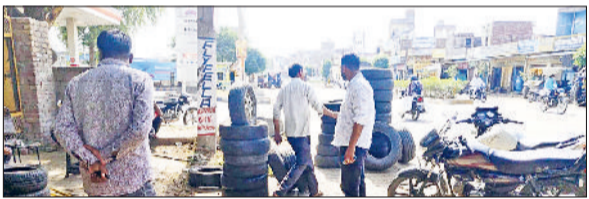
भूना। सड़क किनारे किया गया अतिक्रमण हटाते हुए नगरपालिका की टीम।

बाहर फैले सामान और अस्थायी ढांचे के कारण रास्ता संकरा हो गया था, जिससे आए दिन हादसे की आशंका बनी रहती थी। स्थानीय लोगों द्वारा भी इस संबंध में शिकायतें मिल रही थीं। इसी को ध्यान में रखते हुए नगर पालिका टीम ने मौके पर पहुंचकर