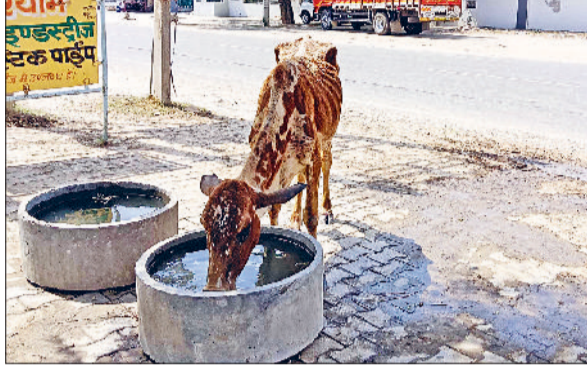
फतेहाबाद। भीषण गर्मी में प्यास बुझाते गोवंश।

जिले में गर्मी ने तेवर दिखाने शुरू कर दिए हैं। शुक्रवार को अधिकतम तापमान 42.8 डिग्री सेल्सियस दर्ज किया गया, जो सामान्य से करीब 4.7 डिग्री अधिक रहा। वहीं न्यूनतम तापमान भी 28 डिग्री दर्ज किया गया, जो औसत से लगभग 4.8 डिग्री ज्यादा है। लगातार बढ़ते तापमान के चलते जनजीवन प्रभावित होने लगा है। दोपहर के समय बाजारों में सन्नाटा पसरा रहा और लोग घरों में ही रहने को मजबूर दिखे। बाहर निकलने वाले लोग शीतल पेय पदार्थों का सहारा लेते नजर आए। मौसम विभाग ने शनिवार के लिए भी हीट वेव का येलो अलर्ट जारी किया है। 26 व 27 अप्रैल को धूल भरी आंधी और बिजली चमकने की