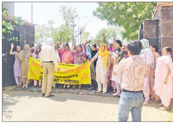
फतेहाबाद। मांगों को लेकर डीसी कार्यालय पर प्रदर्शन करती आंगनवाड़ी वर्कर्स।