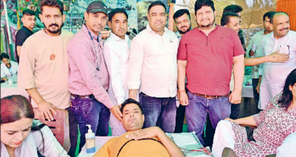
भद्रकाला। गांव रामसरा में रक्तदाताओं को प्रोत्साहित करते अतिथिगण।