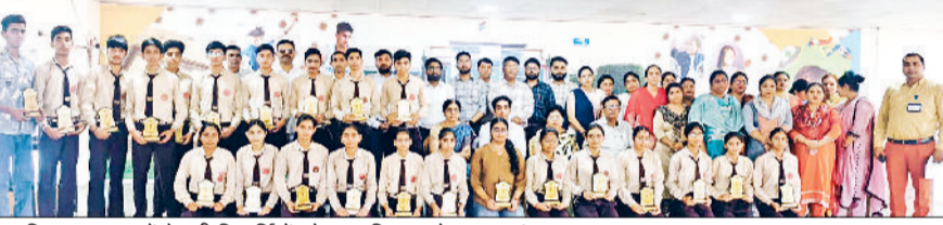
भूना। विश्वास स्कूल में मेधावी विद्यार्थियों को सम्मानित करते स्कूल प्रबंधक।

हरिभूमि न्यूज़ ▶▶ भूना सीबीएसई की 10वीं कक्षा के शानदार परिणाम और आईआईटी जेईई मेन्स में मेरिट हासिल करने वाले विद्यार्थियों को शुक्रवार को स्कूल प्रबंधन द्वारा सम्मानित किया गया। इस अवसर पर मेधावी विद्यार्थियों को स्मृति चिन्ह देकर उनकी उपलब्धियों को सराहा गया। 10वीं कक्षा के परिणाम में खंड भूना