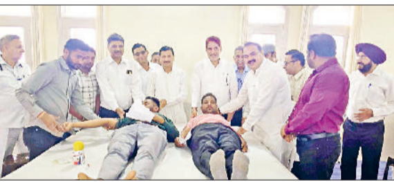
टोहाना। शिविर में रक्तदाताओं का हौसला बढ़ाते सांसद सुभाष बराला।

इस शिविर का शुभारंभ करते हुए सांसद ने कहा कि ऐसे आयोजन न केवल स्वास्थ्य सेवाओं को मजबूती प्रदान करते हैं, बल्कि समाज में एकजुटता का संदेश भी प्रसारित करते हैं। शिविर के दौरान सांसद सुभाष बराला ने प्रत्येक रक्तदाता पास जाकर