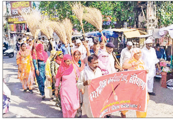
फतेहाबाद। मांगों को लेकर प्रदर्शन करते नगरपरिषद कर्मचारी।